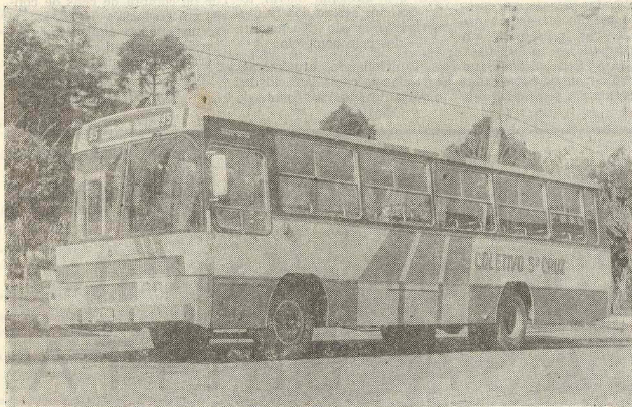
A MAIS RECENTE AQUISIÇÃO DE UM TOTAL DE 16 VEÍCULOS.

E, foi nesta data, que colhemos o real significado da palavra UNIÃO, responsável principal, pela premissa maior de valorização de nossa terra em prol de nossa coletividade.