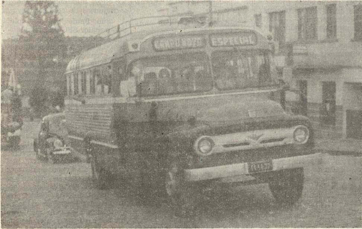
PRIMEIRO CARRO ADQUIRIDO PELA EMPRESA EM 1969.

No evoluir de uma década e meia, era justo, que a Empresa de Transporte Coletivo Santa Cruz Ltda., fundada em 16 de junho de 1969, comemorando estes seus 15 anos de uma efetiva participação na vida Canoinhense, viesse de público agradecer à coletividade, que tanto colaborou no engrandecimento de nossos esforços.