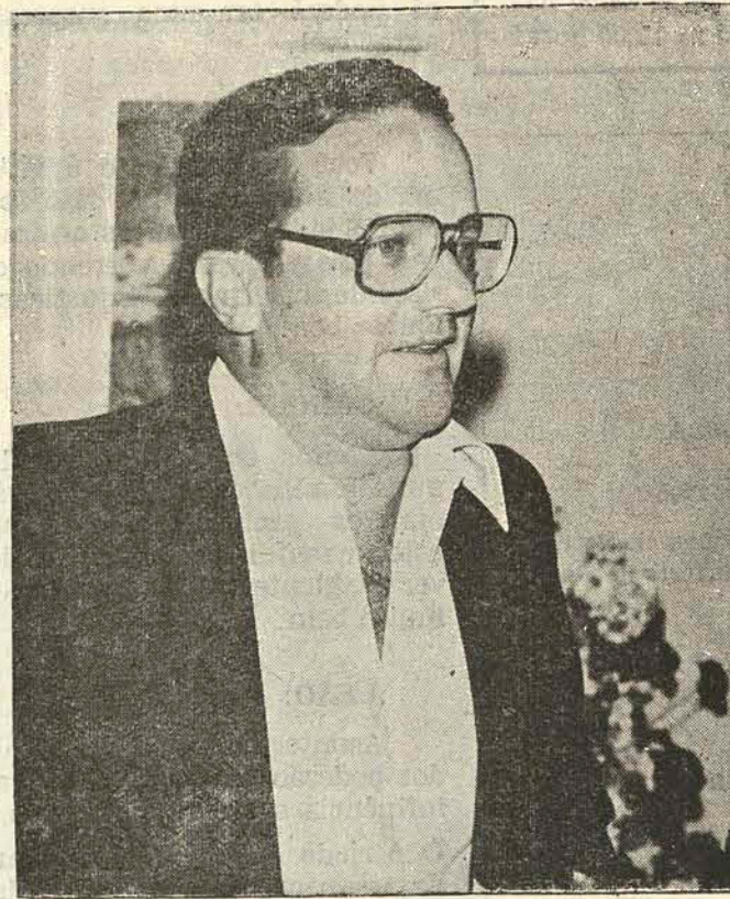
Bornhausen agora na presidência nacional do PDS.

O senador Jorge Bornhausen, do PDS catarinense, assumiu interinamente a presidência nacional do partido, após a demissão de José Sarney. No próximo dia 25, Bornhausen reunirá a executiva do PDS para decidir ou não pela realização da prévia que poderá indicar o candidato à sucessão presidencial.