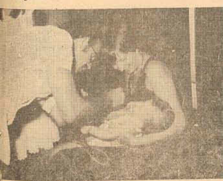
a - qualidade de vida

A melhoria da qualidade da vida é o objetivo material de todo ser humano. É por isso que ele trabalha. É por isso que ele se esforça. É por isso que ele sacrifica o lazer. A vida material somente será melhor se houver, de um lado, o esforço de trabalho da pessoa, e de outro, a presença do Estado garantindo a eficácia do trabalho.