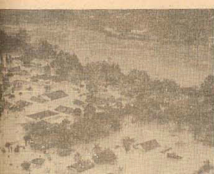
ra e na gente