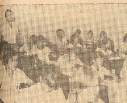
a - aposta no futuro