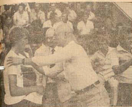
para os jovens.