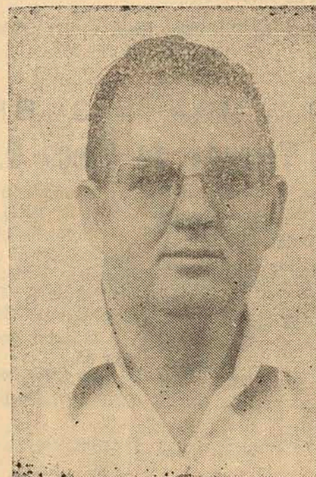
Fábio Nabor Fuck Vice-Prefeito