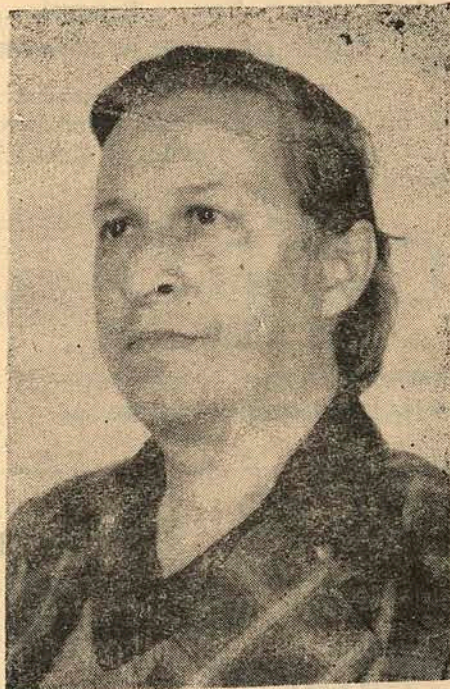
Benedito Therézio de Carvalho Netto Prefeito Municipal