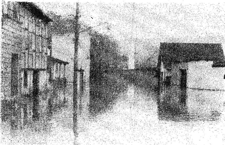
No centro de cidade, um dos locais mais castigados, foi a rua Pastor Hess (foto). Lá, várias residências foram alagadas pelas águas, causando sérios prejuízos.