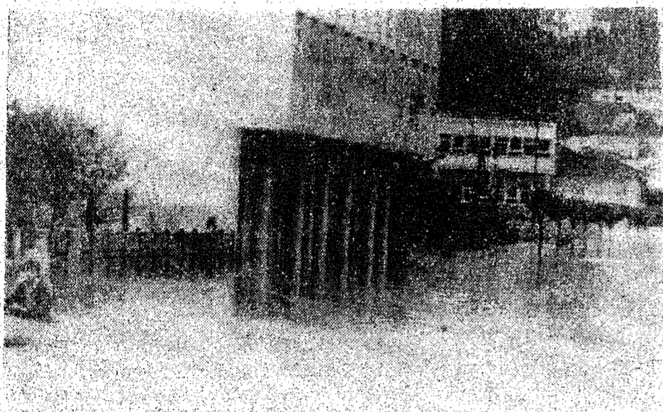
A Rua Nereu Ramos também não escapou das cheias, o mesmo acontecendo com a Pandá Calógeras onde se situa o Colégio Pedro II, cujo estabelecimento suspendeu as aulas, no dia de ontem, devido a impossibilidade dos alunos em para lá se locomoverem.

No entanto, no dia de hoje as águas deverão baixar.