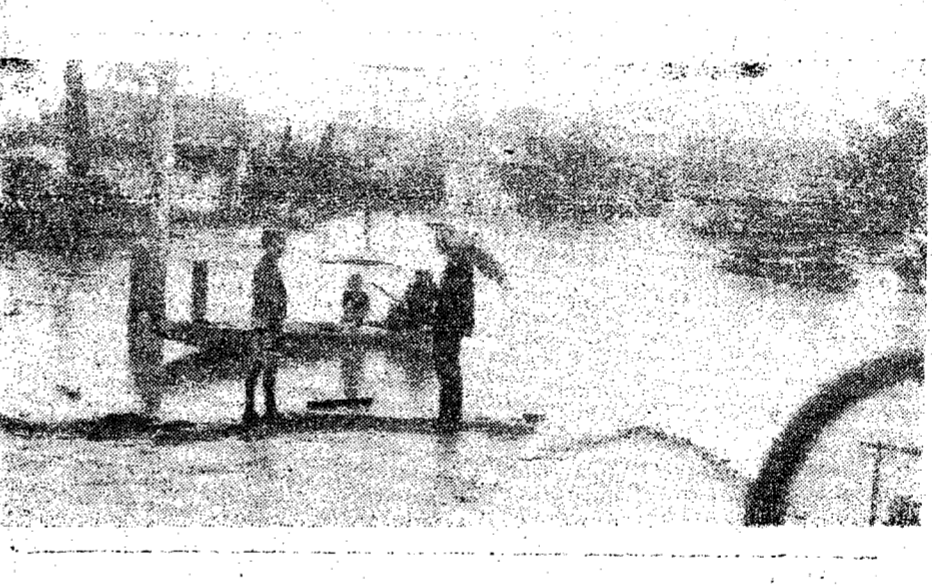
O bairro de Vila Nova também sofreu as consequências da enchente. No flagrante, a sempre presente embarcação à remo (canoas) para a travessia de pessoas residentes no local.