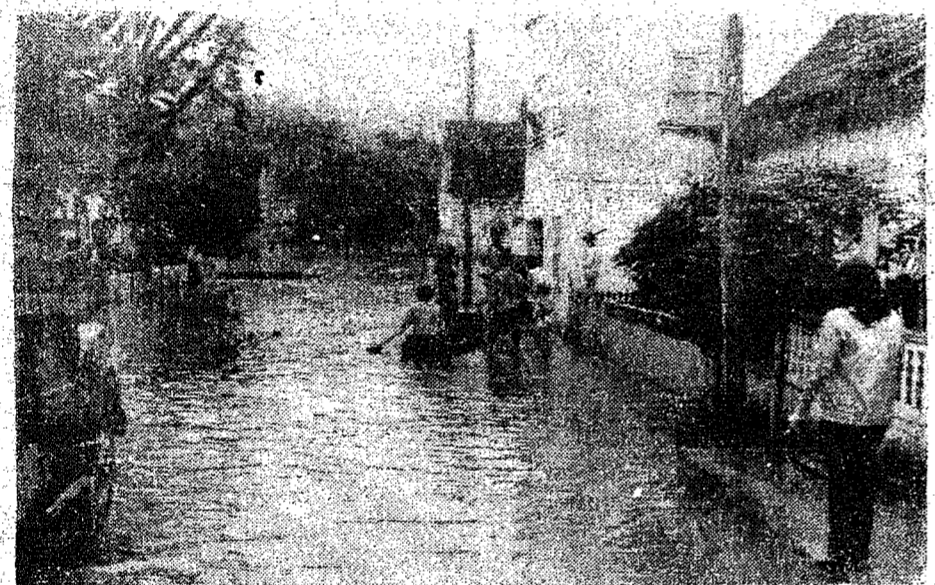
Na foto, a rua Rotary Clube (Garcia) onde a canoa virou o único meio de transporte para os moradores locais. Também ali, várias residências foram tomadas pelas águas.