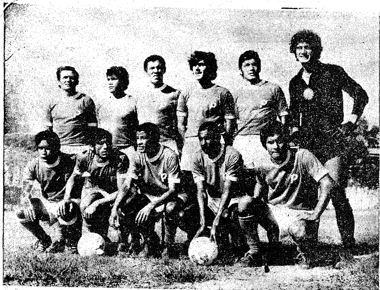
A peléja Próspera e Figueirense, número nove do teste 95 da Loteria Esportiva do Brasil, foi antecipada para as 10 horas da manhã de domingo, no estádio Mário Balsini, em Criciúma. Depois do empate de Tubarão os integrantes do time da "raça", estão bem animados e ainda com as esperanças voltadas para a classificação. Na opinião do treinador Hélio Pimentel, o Figueirense, não ganha em Criciúma, e o Internacional, também não passa pelo Caxias. Outra coisa: O América vai vencer o Figueirense na última rodada. Com isso — diz Pimentel — nós, ainda podemos nos classificar. E para finalizar concluiu o treinador: "nossa vitória contra o Figueirense não é "zebra", marquem todos coluna um.