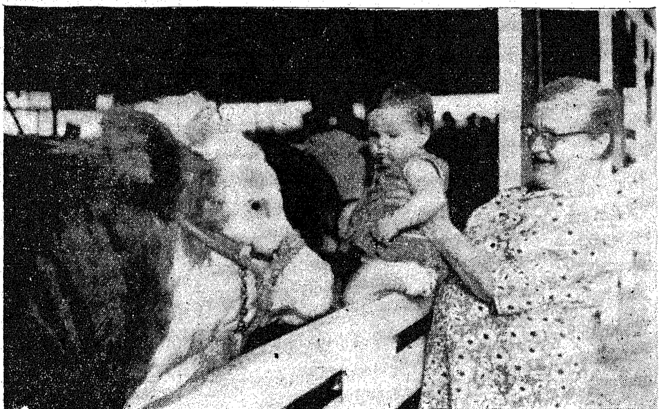
A AGROPEC não fez restrições a idade, fazendo a vovó levar a netinha para ver de perto o que de bom havia.