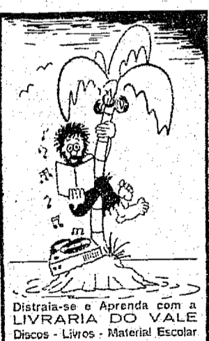
Distraia-se e Aprenda com a LIVRARIA DO VALE Discos - Livros - Material Escolar

FIGUEIRAS S. A. "TEMOS VAGA PARA DOIS AUXILIARES DE DEPARTAMENTO DE PEÇAS, UM TORNEIRO E UM MECÂNICO." OS INTERESSADOS DEVERÃO ESTAR QUITES COM O SERVIÇO MILITAR. APRESENTAÇÃO À RUA S. PAULO Nº. 2711 - BLUMENAU".