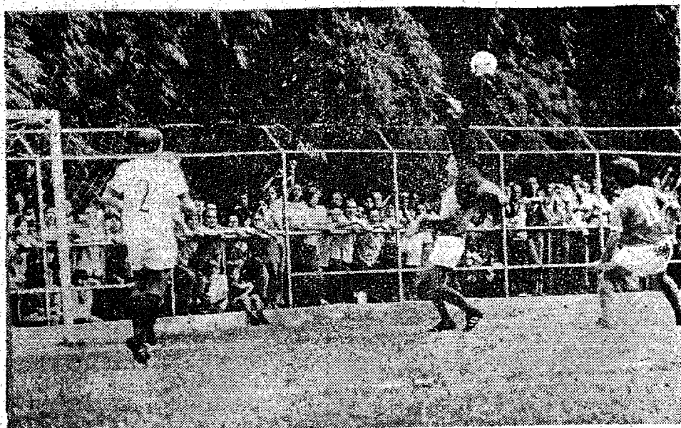
No jogo de Brusque, o Palmeiras perdeu mas seu ataque pressionou muito como mostra a foto. Domingo os periquitos esperam fazer os gols suficientes para alcançar a vitória.

No clássico sensacional de domingo pela manhã no Aderbal Ramos da Silva, além da luta pelos dois pontos, teremos ainda em disputa um riquíssimo troféu instituído pela Vera Cruz Auto Peças, organização blumenauense, que vai comemorar 10 anos, e que assim também colabora com o futebol. Se não houver vencedor no prêmio de domingo, o troféu ficará para ser disputado numa próxima oportunidade, por Palmeiras e Paisandu, segundo adiantou a reportagem de Sr. Odílio Cruz, dirigente da aquela organização. O troféu já se acha exposto numa das vitrines da Camisaria Burger.