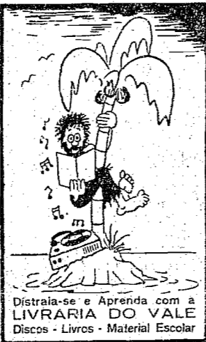
Distribua-se e Aprenda com a LIVRARIA DO VALE Discos - Livros - Material Escolar