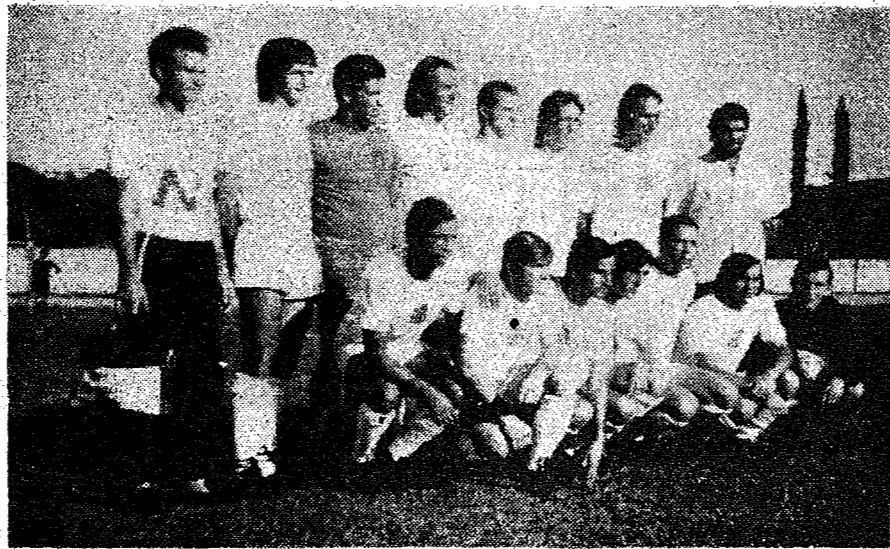
Com os valores que aparecem no flagrante há esperança do Guarani, de estrear com uma vitória.