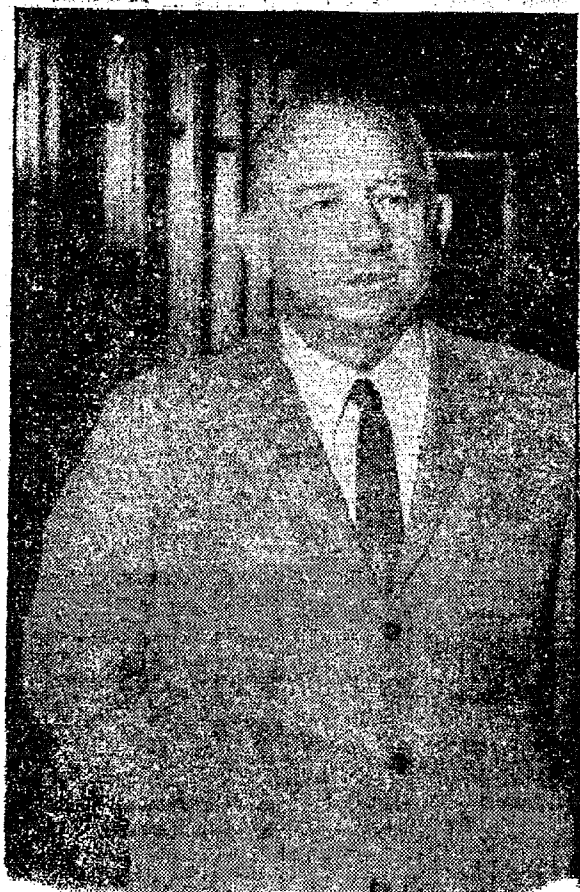
grande beneficiado será o esporte amadorista de nosso Estado.