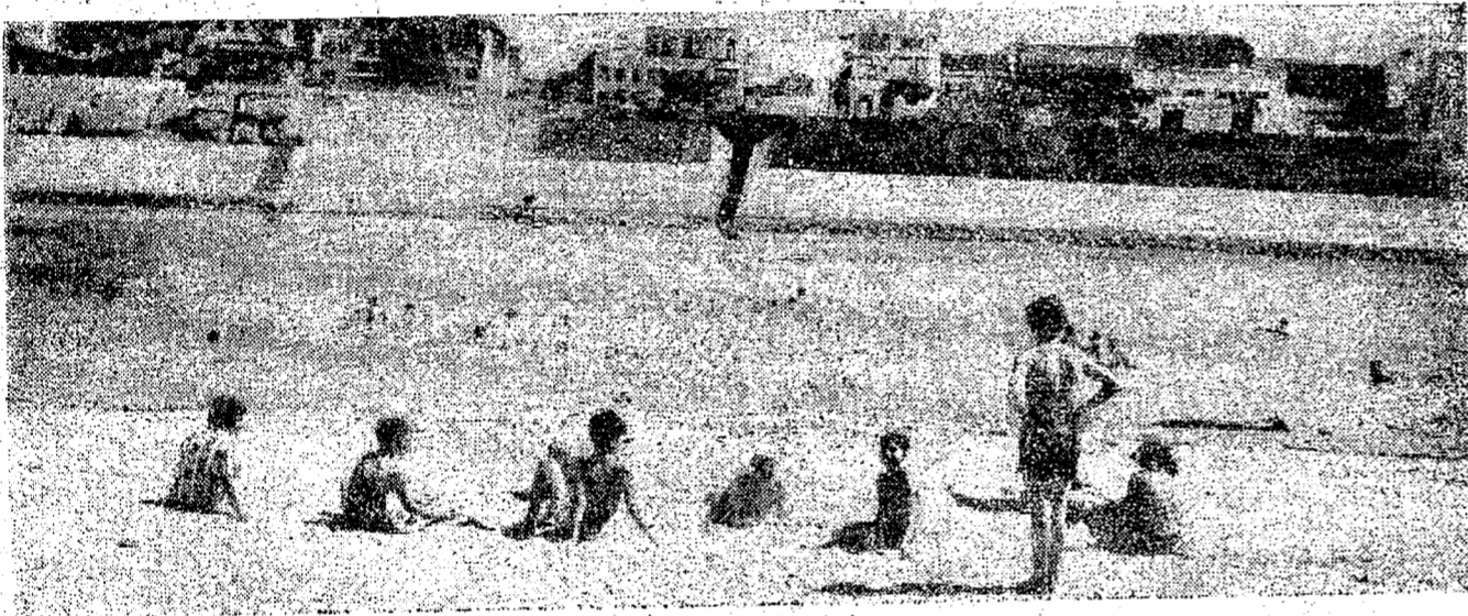
DE RACHAR — O local, o sol, a água límpida: tudo estava convidando para um banho na "Praia", ontem. E isto aconteceu. Dezenas e dezenas de moças e rapazes banharam-se durante toda a tarde. E não só isso. Houve até alguém que levou o cachorro, para o devido banho diário.