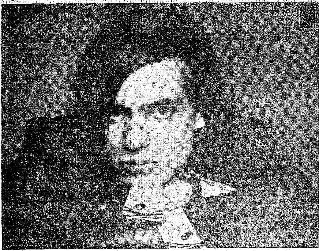
Ronnie Von, quer cortar os cabelos! Leia no RODAPÊ 5