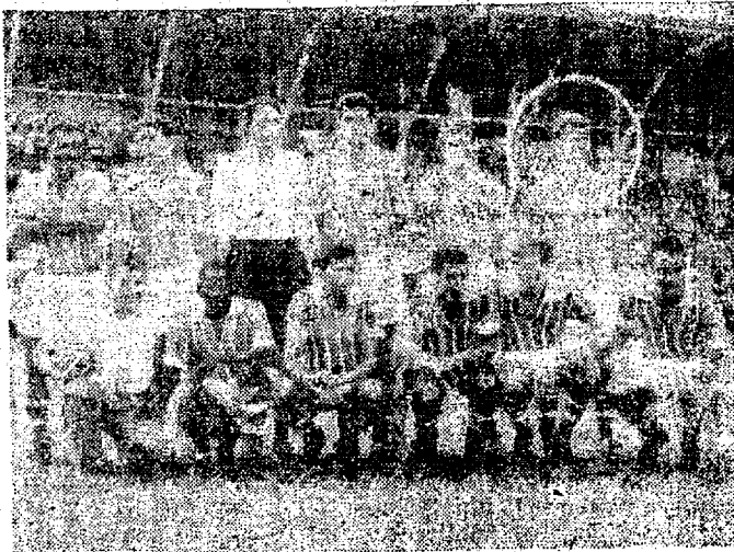
Até 1968 o Renaux foi um time respeitável. No ano seguinte começou a sua decadência.

Muito prestígio, e os seus apaixonados vivem apenas dos pedaços legendários da sua tradição. O Renaux é a imagem da decadência do nosso próprio futebol; todos nós precisamos salvá-lo.