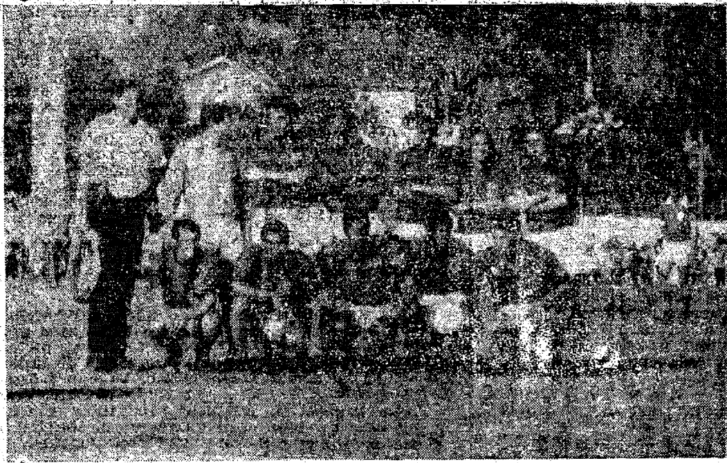
Este time talvez não volte a jogar em 71.