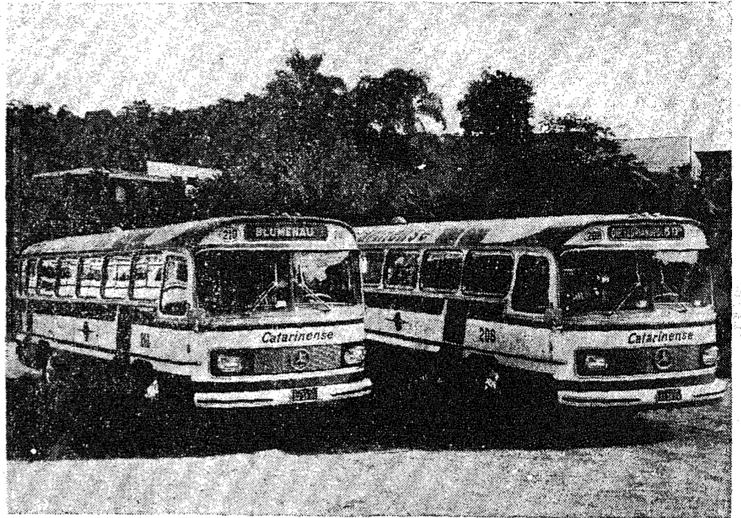
Com capacidade para trinta e seis passageiros cada um e dotado de ar condicionado, a Empresa Auto Viação Catarinense S.A. apresentará hoje ao meio-dia em caráter oficial dez unidades "Mercedes Benz" (Monobloco Super H.S.L. 0352) recentemente adquiridas pela "A Pioneira". Em regozijo ao significativo acontecimento, a Direção da tradicional empresa de transportes coletivos oferecerá uma festiva churrascada na sede do Bela Vista Country Club. No flagrante, dois dos modernos ônibus que vão ser incorporados nesta data à moderna frota da Empresa Auto Viação Catarinense S.A.