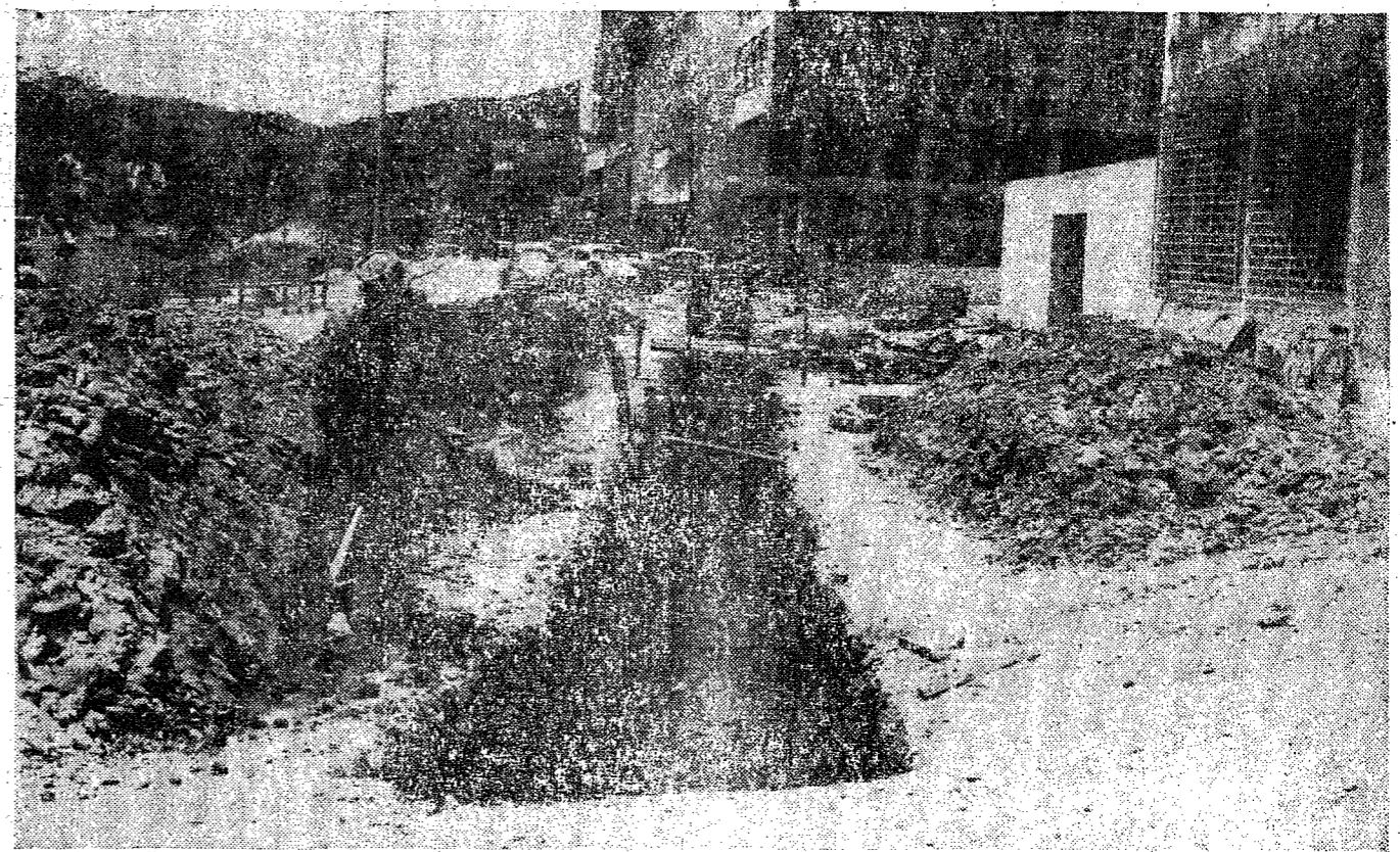
O flagrante acima, fixa o trabalho de abertura de profunda vala, para a instalação da nova rede de esgoto da Avenida Beira-Rio, em vista da anteriormente instalada, haver desmoronado, prejudicando sensivelmente o adiantamento de outras obras. Mas, tão logo haja condições técnicas, a pavimentação da Avenida Beira-Rio, será iniciada.

As grades protetoras, igualmente são fixadas, o que nos permite antecipar um breve término das obras da Avenida Beira-Rio; concretização de um velho sonho dos blumenauenses, que não apenas ganham uma outra via pública, mas que serão beneficiados com o desafogamento do trânsito por ela propiciado, e terão junto ao velho Itajaí-Açu um novo cartão de visitas para a "Cidade-Jardim", centro do turismo permanente do Estado de Santa Catarina.