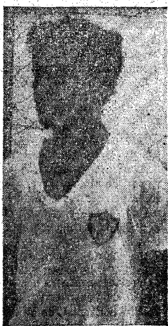
Continuam os preparativos, na Alameda Duque de Caxias, para o jogo de amanhã, quando o Palmeiras...