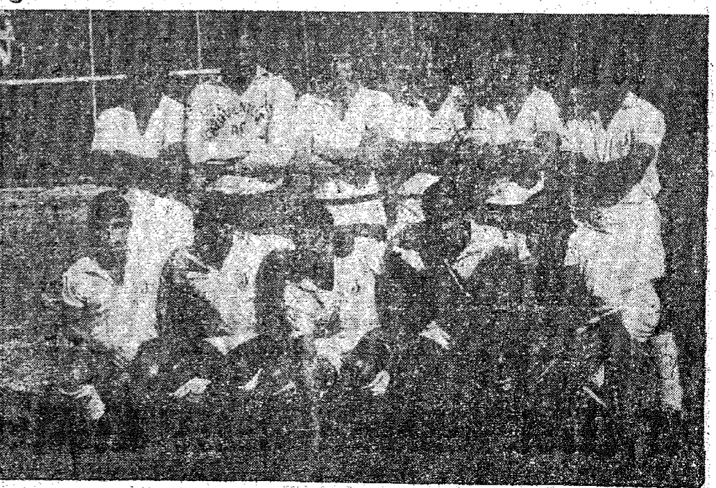
Este é o quadro do Juventus, que foi multado em 30%.