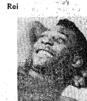
Peiz (foto), que no prêmio diante dos Mexicanos, foi escolhido por parte da imprensa como o melhor jogador de campo, estará

A viagem da delegação brasileira, deverá suceder-se no dia de hoje, em avião especial, devendo esta manhã ser oficialmente recebida a delegação carinense, que empreenderá a viagem a Santiago.