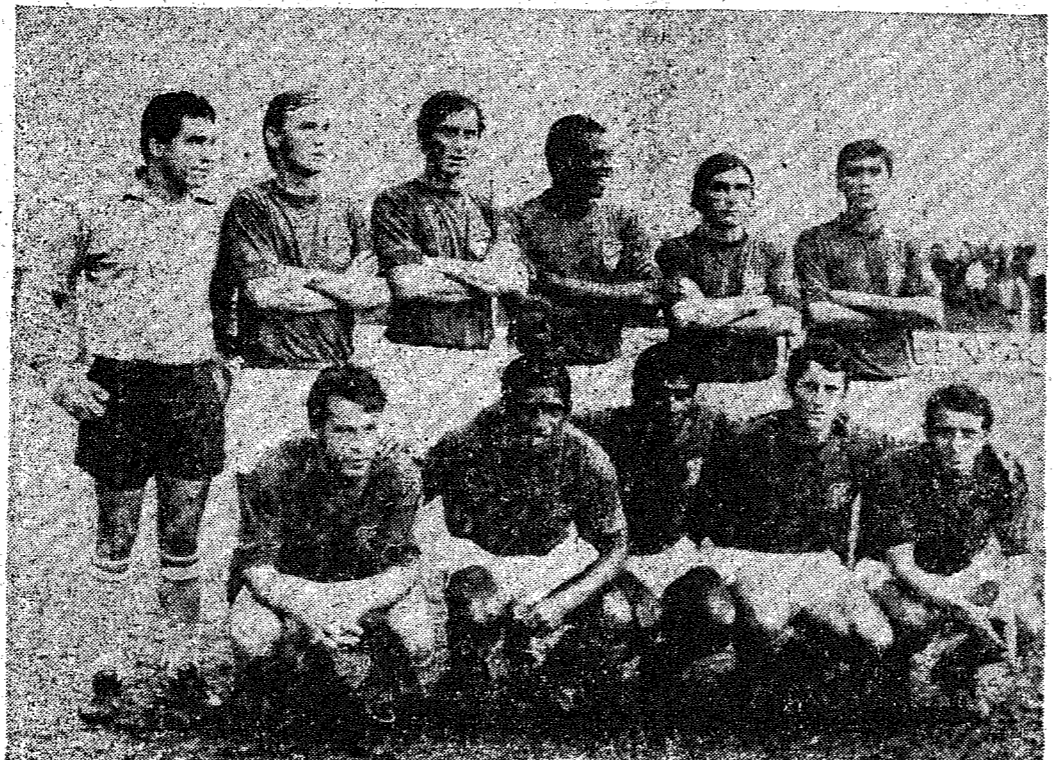
Realizando excelente exibição o Olímpico venceu com méritos inconfundíveis.

Aos 19, em lance trabalhado por Jorginho no corredor direito, a bola acabou novamente nas redes de Angelo que foi batido com uma bomba mortífera do jovem