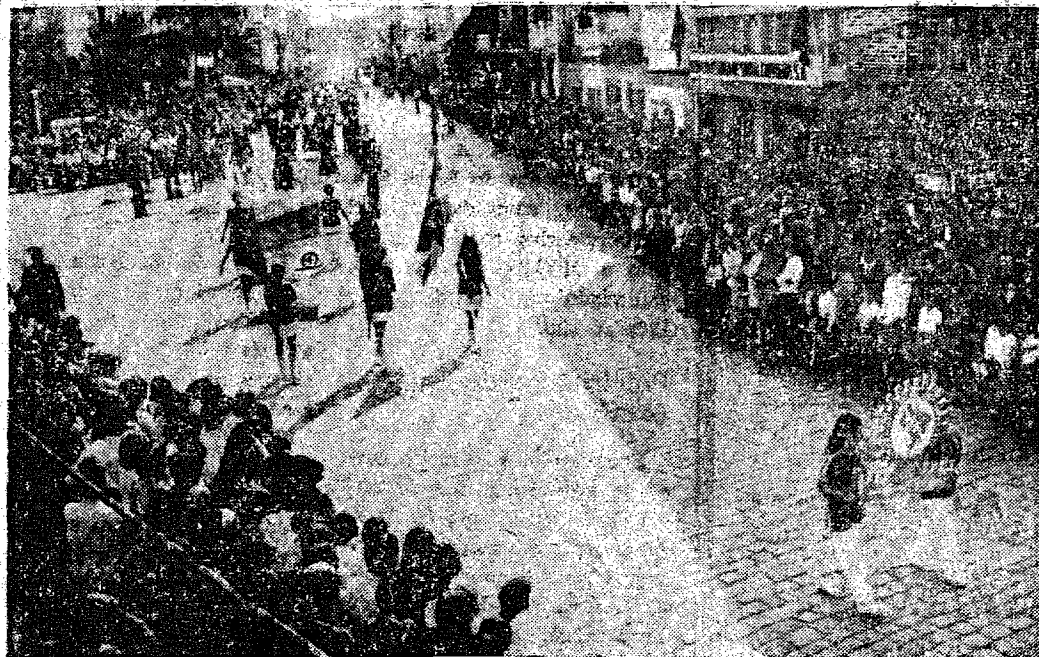
A magnífica demonstração sesiana, no momento em que os participantes do desfile exibiam-se perante as autoridades, na Prefeitura Municipal.

O veterinário de hoje, e com maioria da razão, o de amanhã, aparece, pois, como técnico da produção, conservação e utilização da matéria prima, visando a sua ação, em última análise, obter, reproduzir, conservar e utilizar a máquina animal nas melhores condições de resistência e produtividade.