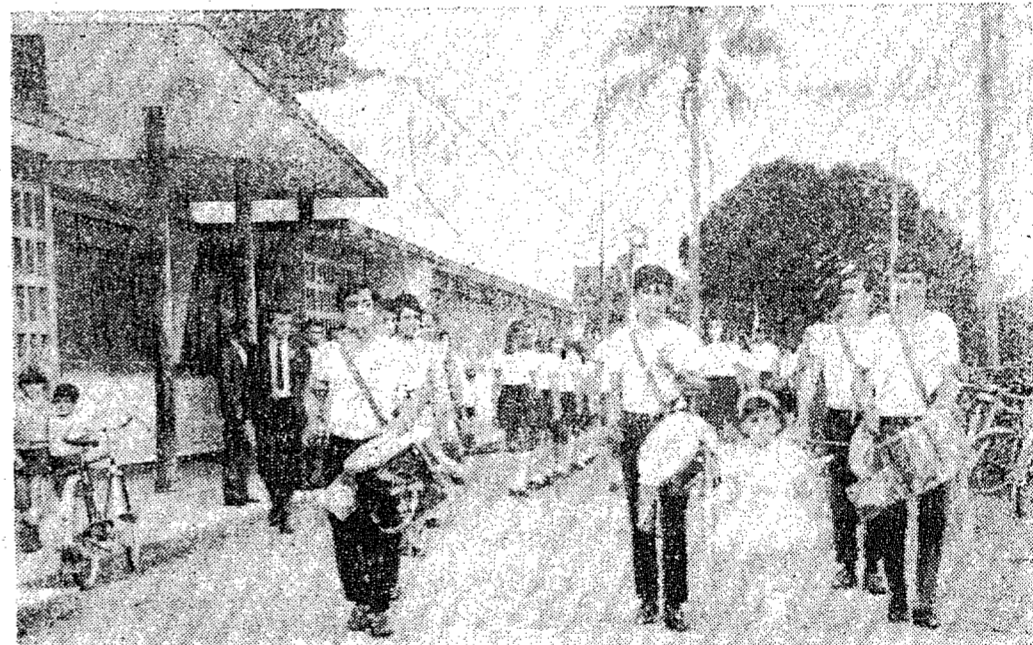
O Município de Ilhota, prepara-se devidamente para as comemorações do próximo dia 7 de Setembro. O Grupo Es-

colar Marcos Konder e Ginásio Normal Ricardo Raulina Anaes (foto) estão atuando os ensaios para o desfile cívico, que é o ponto culminante da programação elaborada por aquela Municipalidade para a "Semana da Pátria" do corrente ano.