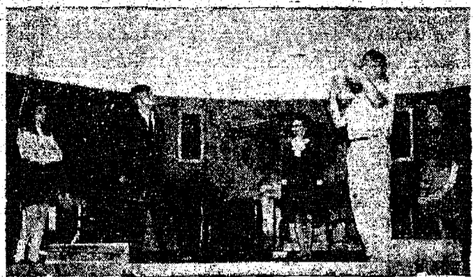
Em 1969 o Teatro Amador de Brusque alcançou grande sucesso com a encenação de "Os Ossos do Barão" (foto), mantendo assim sua tradição de grandes apresentações.