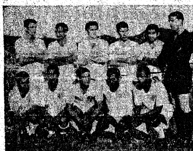
O América, ao lado do Caxias, Palmeiras e Juventus, é um dos clubes mais disciplinados do atual campeonato, pois não teve nenhuma expulsão até aqui.

O ataque do Olímpico, foi o que mais tentos marcou neste primeiro turno. A defesa mais vazada do campeonato catarinense, consignando 30 gols. O ataque que menos marcou até agora o do Guarani de Lages, com apenas seis tentos. A defesa mais vazada, pertence ao Carlos Renaux, com 40 tentos.