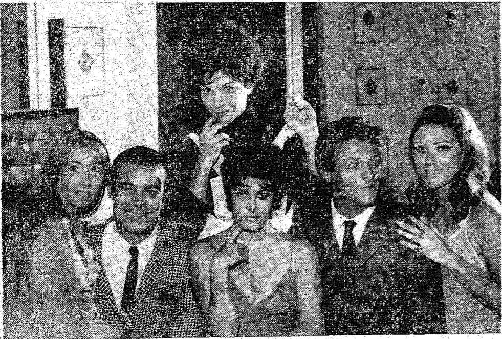
AQUI ESTÁ UMA CENA PARA O BOING-BOING DE AMANHÃ!

presos à noite pela polícia na cidade de Terma, na serra central peruana. Segundo as informações os assassinos degolavam suas vítimas sem nenhum propósito determinado.