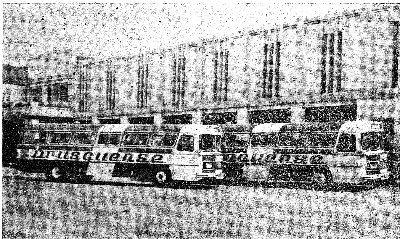
Flagrante dos 2 novos ônibus adquiridos pela Rodoviária Expresso Brusquense S/A, junto a Mercedes-Benz do Brasil S/A, os super modernos 0-352 H/HL, monobloco.