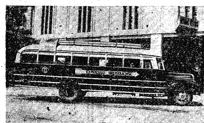
O «saudosos nº 11», um dos primeiros veículos que iniciaram a mais tradicional e completa frota de carros interurbanos do Estado.