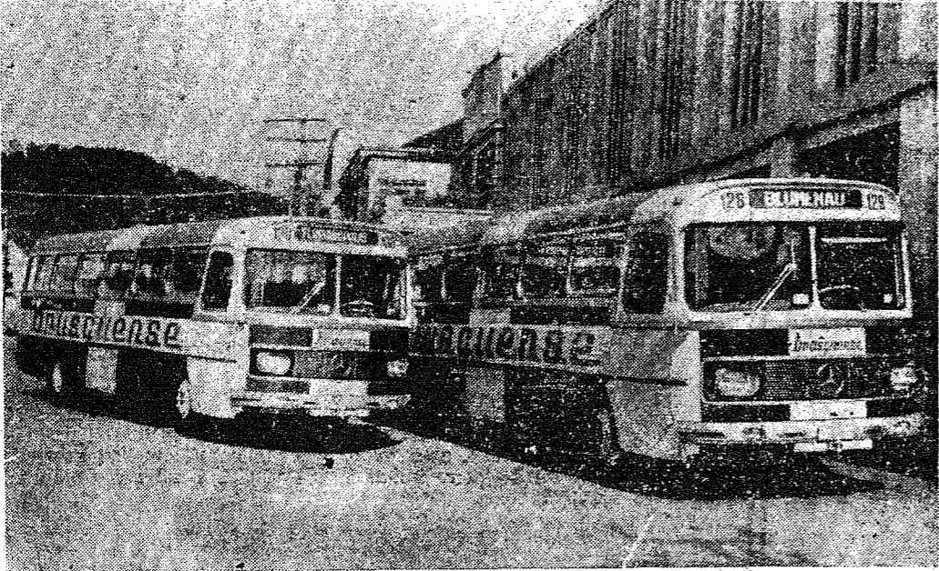
Procurando acompanhar a constante evolução rodoviária do país a BRUSQUENSE adquiriu junto a Mercedes Benz do Brasil S/A seis moderníssimos monoblocos, dois dos quais aparecem acima. O 0-352 H/HL trata-se de um robusto motor, com potência de 130 cv (145 HP/SAE), cujo desempenho assegura ao veículo alto rendimento e máxima economia operacional, fatores que vem somar-se às demais características que distinguem o monobloco 0-352 H/HL na preferência do público.

Como na vida tudo cresce, se transforma, também a BRUSQUENSE foi crescendo, foi se transformando, chegando a se constituir numa das maiores empresas que atualmente corta várias regiões do Estado de Santa Catarina.