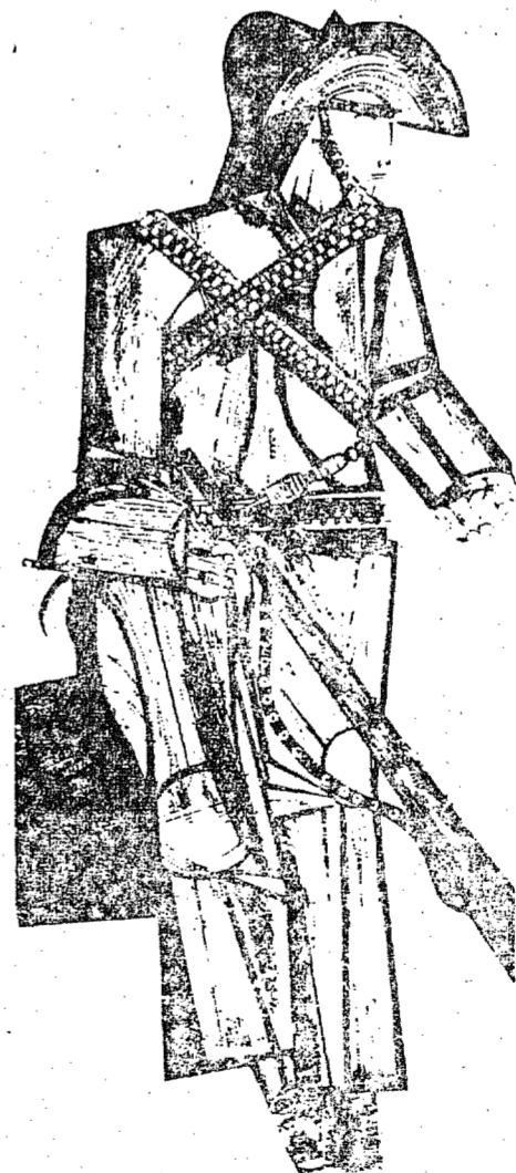
Desenho de Aldemir Martins, leiloado no recente Leilão de Arte Moderna do Guarujá.

Atendendo a convite da Galeria Açu-Açu, o grande pintor não enviará apenas suas obras, mas comparecerá pessoalmente à inauguração de sua primeira exposição em Santa Catarina.