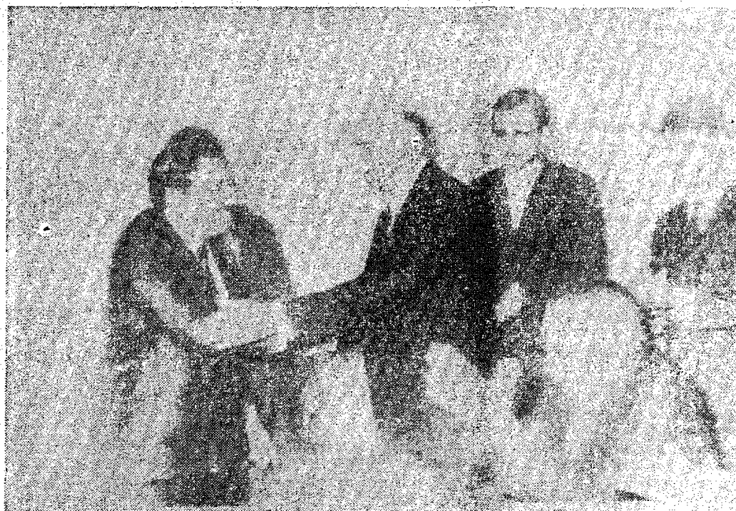
JOINVILLE (CIDADE) — Momento em que o Governador Ivo Silveira entregava o cheque no valor de Cr$ 60.000,00 ao Pastor Burger do Hospital e Maternidade "Bethesda" de Pirabeiraba. A quantia entregue pelo Chefe do Executivo totaliza a importância de Cr$ 80.000,00 destinados à manutenção do citado nosocômio.