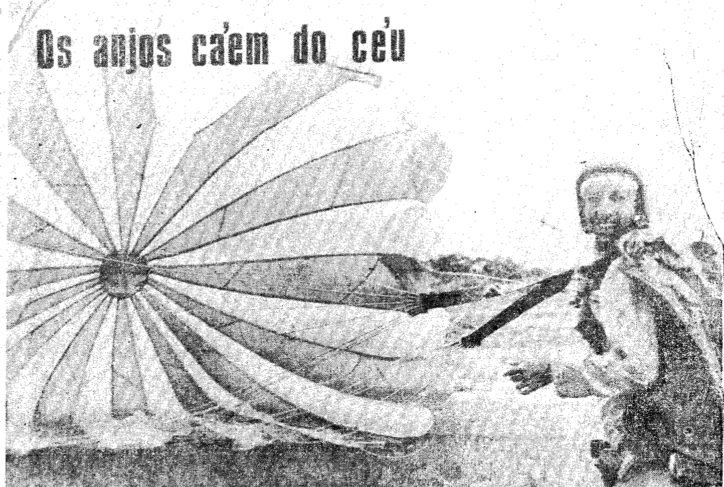
Os anjos caem do céu

A equipe de paraquedismo "ICAROS DO VALE", do Aero Clube de Blumenau, volta a se destacar nas apresentações, que tem realizado em diversas cidades do estado. Aprimorando cada vez mais, os seus conhecimentos e mostrando ao povo, o que já sabe executar, os "ICAROS DO VALE", voltarão a se apresentar, no dia de amanhã. Desta feita, estarão se exibindo em Bechlor Alto, na festa esportiva do Avai Esporte Clube. A apresentação de saltos de paraquedas, serão semi-automáticas e livres, utilizando-se dois aviões, dos tipos F56-C e CESSNA-175 e paraquedas dos tipos TIOF e Tu-5. No clichê, já após a queda, um pa-