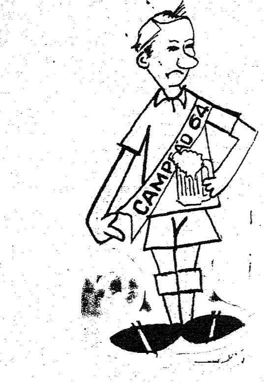
Vamos ver se conseguimos mais uma faixa de campeões estaduais. É o que interessa no momento.

Para a lateral está na cogitação grená, o atleta Tóco, que encontra-se vinculado ao Comércio de Criciúma. Mas um outro profissional, também figura nas pretensões arinhandas. Joca do Fieirense, é o homem preferido para a posição central, havendo também as possibilidades em termos de Pázio que rescindiu contrato com o