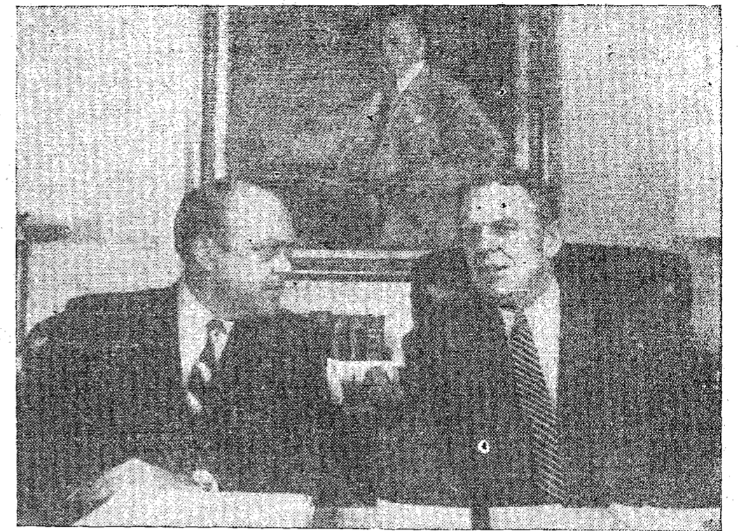
OS HOMENS DA DEFESA — Na foto, o Sr. Melvin Laird (à esquerda), designado Secretário da Defesa, para a Administração Richard Nixon, palestra com o atual titular do Departamento de Defesa, Sr. Clark Clifford, no gabinete deste último, no Pentágono, em Washington. Ao fundo aparece um retrato pintado do primeiro Secretário da Defesa dos Estados Unidos, Sr. James Forrestal. Um novo governo terá início nos E.U.A. no próximo dia 20 de janeiro