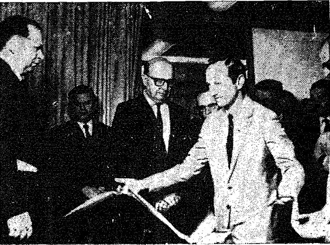
Um aspecto da intensa vida social do Prefeito CARLOS CURT ZADROZNY. O “close” mostra quando desatava a fita simbólica, inaugurando a Caixa Econômica Federal de Santa Catarina em nossa cidade.

CARLOS CURT ZADROZNY estabeleceu — e isso ninguém pode contestar — uma fase toda nova, no que diz respeito à administração municipal.