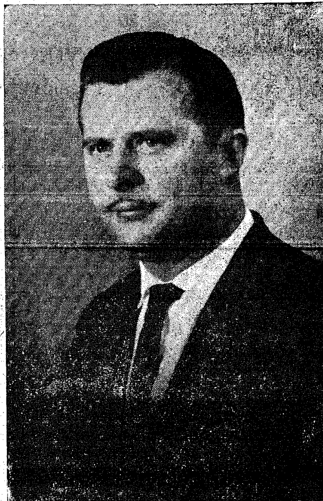
Na foto o Prefeito Municipal de Pomerode, Sr. Ralf Knaesel, que vem desenvolvendo um trabalho verdadeiramente digno de nota, na Comuna que administra.

A Faculdade de Educação é o primeiro estabelecimento de ensino superior legalizado, definitivamente, em nosso Estado.