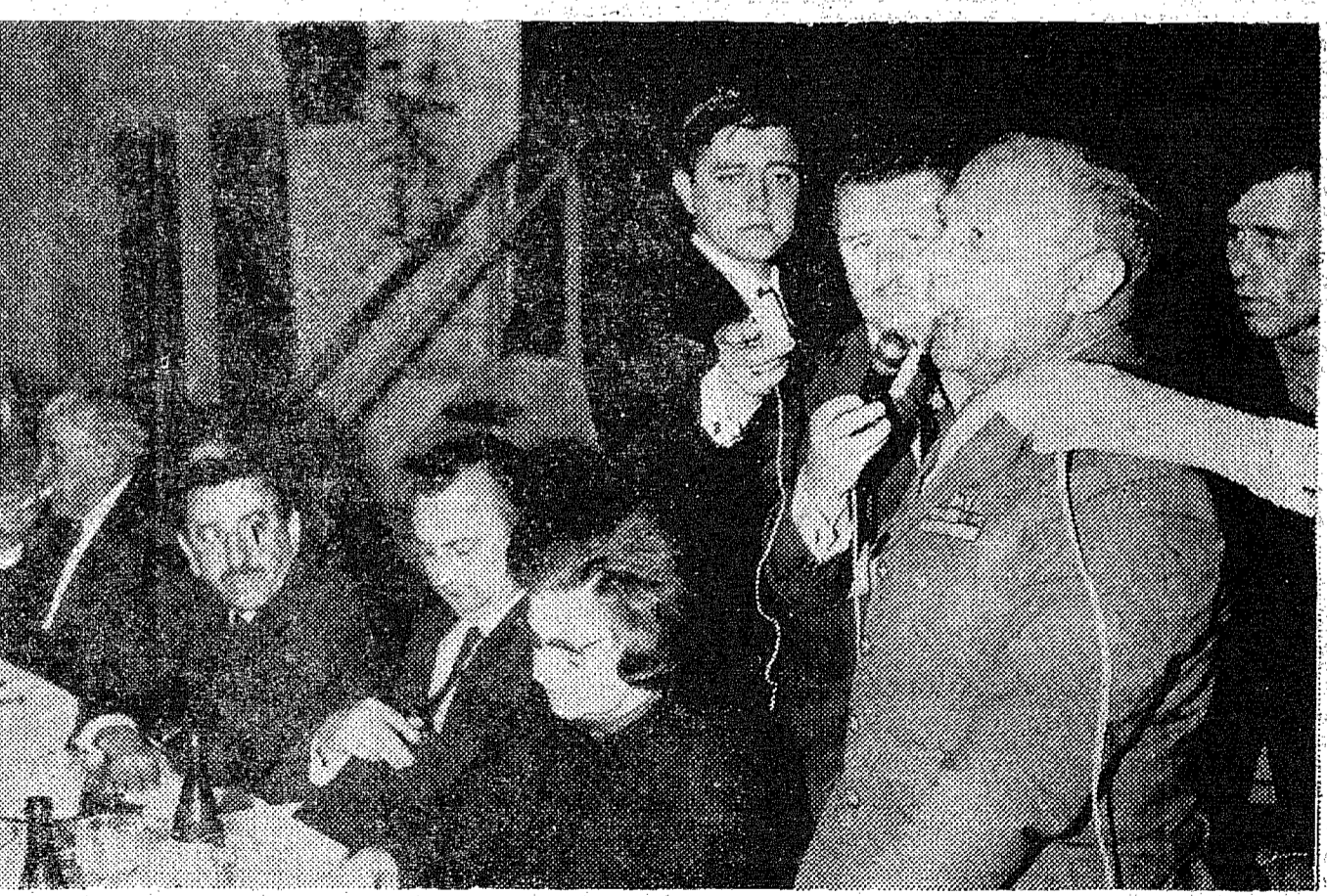
FPOLIS, — São Bento do Sul registrou, com brilhantismo, o seu 95º aniversário, hospedando o Governador do Estado, exma. esposa e altos membros do Governo Catarinense, além de convidados especiais também da esfera federal. O clichê fixa o instante em que o Comandante da 5ª. Região Militar, convidado especial, fazia uso da palavra nas grandes comemorações que enalteciam o Município de São Bento do Sul, "A Princesa das Hortênsias".