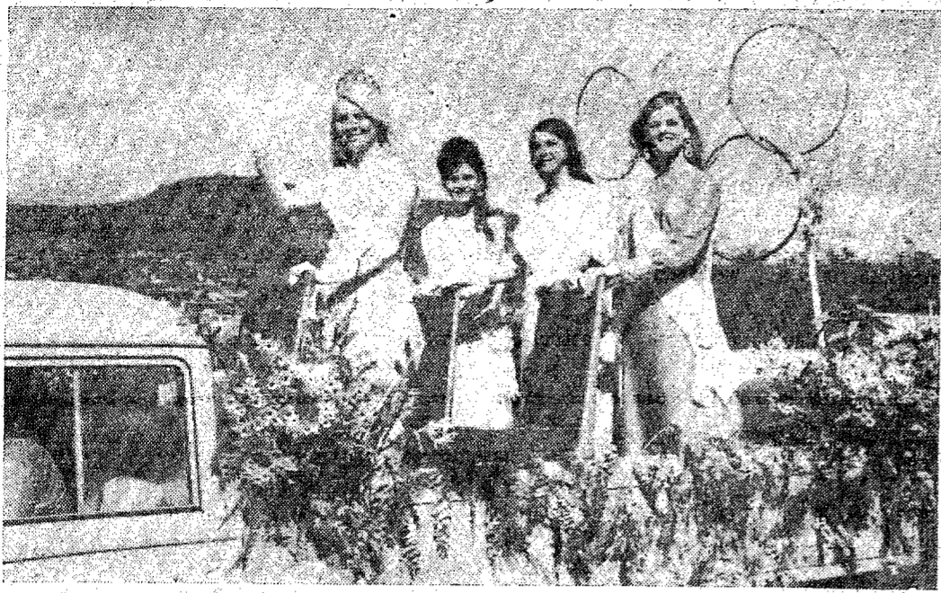
Rainha e Princesas da II OLIMPIADA ESTUDANTIL DE RIO DO SUL. Ilustram nossa página esportiva, quando iniciamos as publicações — em série — de todos os resultados parciais e finais daquela grandiosa competição.

A partir de hoje, estaremos apresentando os resultados parciais e finais de todo o transcorrer da grandiosa promoção rio-sulense, encerrada com excepcional brilho no início desta semana.