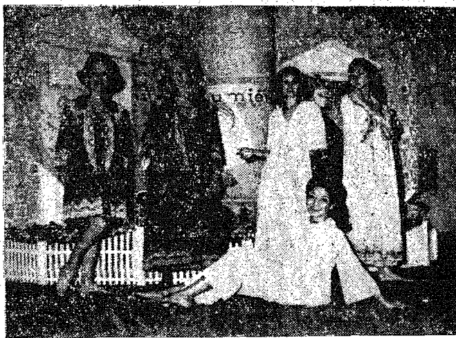
NA FOTO acima aparecem as manequins exclusivas da "Lumière", vendendo-se ao fundo o artístico "stand" desta marca, ne qual foram apresentadas as suas belas criações em roupas íntimas de senhoras, meninas-moças e crianças.

Durante quatro dias do mês em curso, a Guanabara tornou-se a Capital da Moda, com a realização do famoso "September Fashion Show", o encontro anual dos exponents máximos da indústria brasileira de moda. Nossa cidade mereceu as atenções do mundo elegante brasileiro e internacional ali presentes, com os produtos da festejada marca "Lumière" ocupando o artístico "stand" na exposição do Copacabana-Palace e com as manequins exclusivas realizando vitoriosos desfiles.