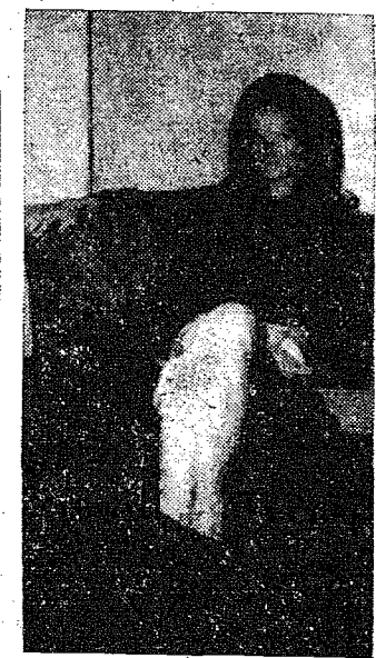
Em pose exclusiva para a "Lumière", vemos na foto a famosa Veruschka, célebre condessa alemã, manequim profissional mais bem paga do mundo e cuja altura (1 metro e 83 centímetros) é muito comentada.