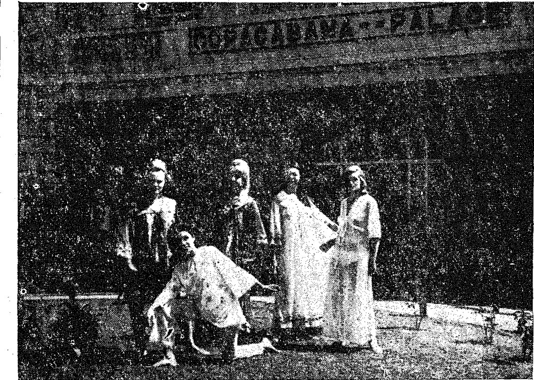
NO FLAGRANTE vemos as manequins exclusivas da "Lumière", nos jardins do Copacabana-Palace, que apresentaram a coleção 67-68 desta marca no festejado "September Fashion Show", alcançando muito sucesso.

"STAND" E DESFILES A marca joinvilense "Lumière" (da firma Casimiro Silveira S.A. Indústria e Comércio), montou artístico "stand" no Copacabana-Palace, o qual serviu de "back ground" para a sua equipe de manequins exclusivas. Em desfiles muito aplaudidos, tanto no salão nobre no "Golden Room" do Copacabana Palace, as manequins "Lumière" apresentaram as mais recentes criações desta festejada marca, com modelos da "Coleção Moda Jovem 68", os quais mereceram muitos elogios, o que representa a afirmação da qualidade, elegância e bom-gosto desta marca.