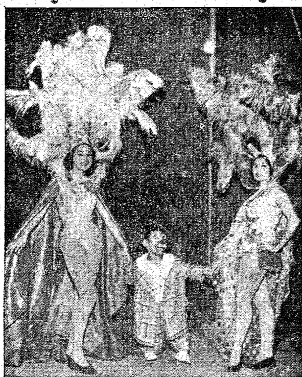
O anõesinho Rolinha, uma das atrações

Na próxima sexta-feira estreia em Joinville o "Grande Circo Ringlins Barnum", depois de uma temporada em Curitiba, que durou trinta dias, e durante os quais foram apresentados quase uma centena de espetáculos, sempre com grande público presente.