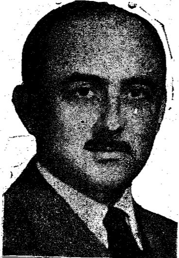
GOV. JORGE LACERDA

das questões prementes ligadas a triticultura. Considero fundamental para a vida econômica do país o estímulo a produção do trigo, mas sobretudo o amparo ao nosso produtor, após a colheita do cereal: garantia de preços satisfatórios certe-