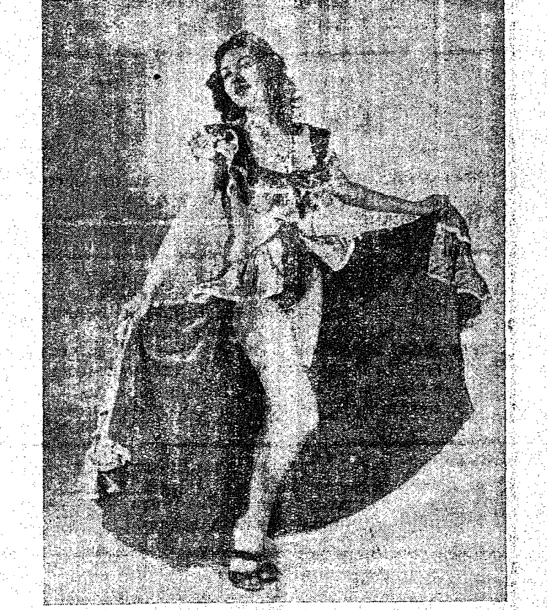
UMA DAS GRANDES ATRACÇÕES DA FAMOSA ORQUESTRA CENTRO-AMERICANA "CUZCATLAN"

Os amplos e suntuosos salões de dança do Teatro Carlos Gomes, se iluminarão, mais uma vez, no próximo dia 8 de Maio, com o lugar a mais um expressivo acontecimento social, quando deverá ganhar contornos verdadeiramente empolgantes, com a vinda, até nós; da famosa Orquestra Centro-Americana "TEARIMBAS CUZCATLAN", que logrou êxito absoluto na sua primeira apresentação, nesta cidade; deixando excelente impressão. Depois daquele sucesso sem precedentes, alcançado pelo BAILE DE PASCOA, que a fraterno sociedade blumenauense se fez realizar em conjunto com o Marabá, o reveillon de 8 de Maio, deverá refestil-se de um brilhantismo que corresponda em cheio a grande expectativa reinante por parte de seus associados, sequiosos que estão por ver, uma vez mais, a Orquestra que tão grata impressão nos causou, evidenciando-se como um dos melhores conjuntos orquestrais que temos conhecido. Tal iniciativa, deve-se a esforçada comissão de festejos do Carlos Gomes, que não tem medido esforços e sacrifícios no sentido de proporcionar aos seus sócios, motivos de alegria e sã diversão. Consoante informações a nós prestadas, foi determinado que a reserva de mesas deverá ser feita a partir do dia 3 de Maio, com o zelador do clube; ao preço de Cr$ 240,00, com 4 cadeiras e Cr$ 380,00, com 6 cadeiras. Sem dúvida alguma, mais esse acontecimento social da simpática agremiação, deverá alcançar o sucesso que bem merece.