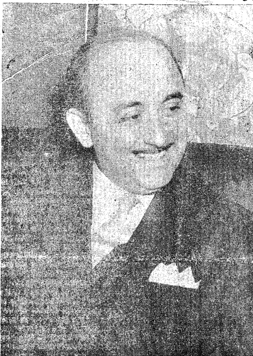
GOVERNADOR JORGE LACERDA

século dezenove, pelo grito de verdadeira revolução branca, através das eternas encíclicas dos Papas