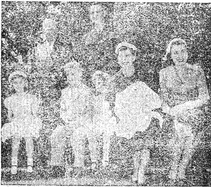
RETRATO DE FAMILIA EISENHOWER