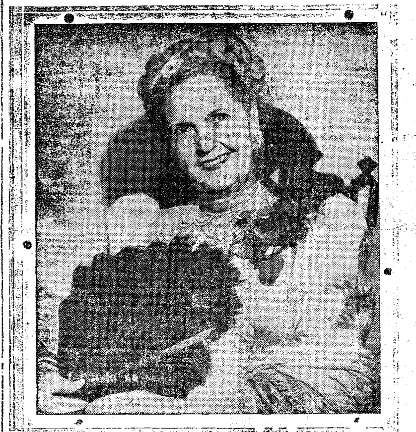
FELISA RINCON DE GAUTIER, PREFEITA DE SAN JUAN, PORTO RICO.

As compras referidas estão sendo processadas pelo rigoroso critério legal da tomada de preços, em virtude de não permitirem os trabalhos em apreço, dada a urgência com que precisam ser ultimadas as delongas processuais de concorrência pública.