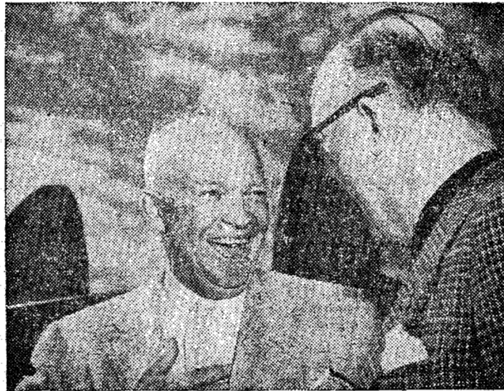
BOCA CHICA — FLORIDA — O Presidente Eisenhower e seu irmão Milton (à direita) conversam na base aérea naval de Boca Chica enquanto o Presidente se prepara para retornar à Casa Branca em Washington. O Presidente passou duas semanas em Key West, na Flórida, de férias e completando sua mensagem à União e outras mensagens especiais para entregar ao Congresso Norte-Americano.

O desenvolvimento econômico do município pode ser medido pelo seu desenvolvimento comercial e bancário. Em 1950 o valor das vendas no comércio atacadista e varejista (346 milhões de cruzeiros) era relativamente pouco inferior ao do município da Capital (497 milhões). No setor bancário, Blumenau se avanteja a Florianópolis em várias das principais contas — em todas, sua participação vai de 10 a 20% do total estadual".