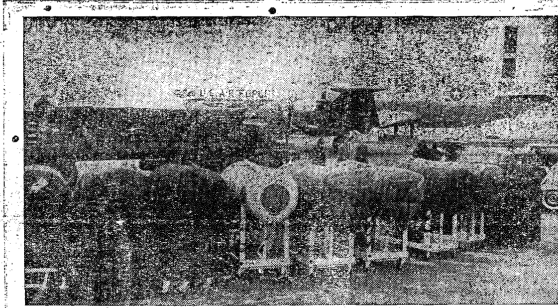
BOSTON, Massachusetts — Pulmões de aço recentemente enviados à Buenos Aires num avião "Globemaster" da Força Aérea Norte-Americana, para ajudar no combate à epidemia de poliomielite na capital da Argentina, onde mais de 800 casos foram assinalados desde 21 de janeiro. Os pulmões de aço foram enviados pelo governo norte-americano com a cooperação do "Pan American Sanitary Bureau" e da "U. S. National Foundation for Infantile Paralysis". Foi também enviado um grupo de especialistas, constante de um médico, uma enfermeira e terapeuta.