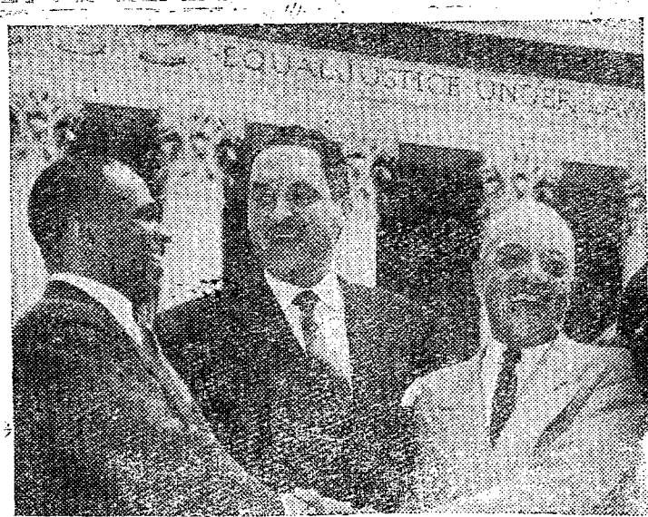
A Corte Suprema dos Estados Unidos decidiu recentemente que as leis de segregação racial até então em vigor em numerosos Estados norte-americanos são inconstitucionais. A fotografia mostra os tres proeminentes advogados negros que lutaram perante aquele alto tribunal contra a segregação racial nas escolas publicas dos Estados Unidos. Da esquerda para a direita, vemos os

Depois de haver lamentado a tática adotada na Italia e na França pelos adversarios da CED; cujo tratado ainda não foi ratificado por parte dos parlamentares dos dois países. Dulles resalta que os Estados Unidos serão obrigados a modificar radicalmente sua politica, no caso de malogro da tentativa de realização do Exercito Europeu.