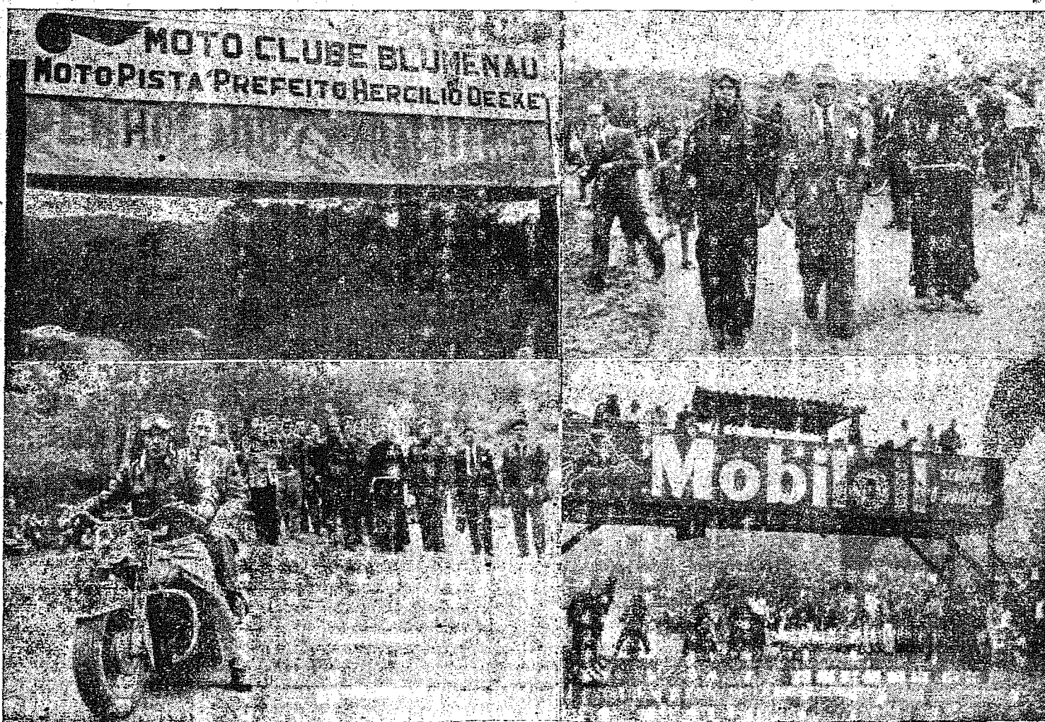
Flagrantes das solenidades da inauguração da Moto Pista "Prefeito Hercilio Decke, que antecederam, a 6 de Setembro, as grandiosas provas motociclisticas realizadas naquela ocasião e que alcançaram pleno êxito. Para as provas de amanhã, tem-se como certo sucesso muito maior ainda do que o anterior.