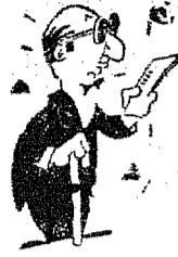
TABELA DOS JOGOS

graça surpresa aos seus aficionados, porquanto o seu 'expressivo' revelou pendores para o futuro. Com relação ao seu adversário, muito embora tenha sido derrotado, não chegou a decepcionar, esperando melhores oportunidades. O Guarani, com os reforços angariados, poderá surpreender a cátedra, pois entusiasmo e força de vontade é o que sobra aos seus defensores. O Floresta, de Rio do Testo, está embalado, possuindo um conjunto bem harmonioso, aparecendo como uma das atrações para domingo. O União, de Timbó, conquanto não tenha sido algo feliz em seus recentes compromissos, é detentor de um bom conjunto, dependendo de chance o seu sucesso. O Vera Cruz, de ha muito afastado das lides esportivas, está trabalhando na 'surdina', afiançando seus dirigentes que o 'onze' voltará a brilhar assim como o fez no certame oficial do ano passado. O Tupi, de Gaspar, ora sob a orientação do técnico Lino, promete muitas surpresas com a sua 'prata de casa'. Ainda no domingo que se passou, derrotou convincentemente o Guarani, demonstrando um preparo satisfatório. Os clubes Blumenenses, Carlos Renaux e Paisandú, constantemente em atividade, surgem como os mais credenciados a se laurearem neste torneio-inicio, mas é melhor aguardarmos o seu desenrolar.