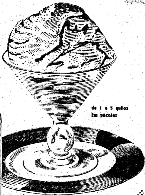
de 1 e 5 quilos Em pacotes

PALMYRO GOMES VIDAL Caixa Postal, 42 JOINVILE — Santa Catarina