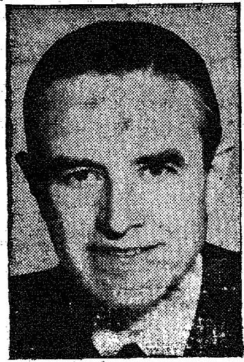
AVERELL HARRIMAN GOVERNADOR ELEITO DE NOVA IORQUE

WASHINGTON, 4 — As apurações das eleições norte-americanas estão na iminência de serem encerradas.