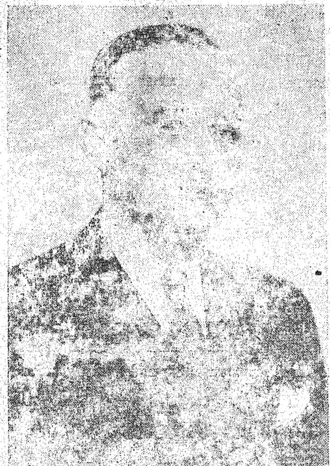
Irineu Bornhausen: candidato acima dos partidos

Essas são as circunstâncias. É preciso conhecê-las, sobzê-las, antes de fazer um diagnóstico simplificado que relegue o fenómeno do quererismo