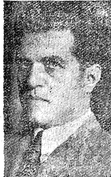
O 'moleque' Luzardo no dizer do genl. Flores da Cunha